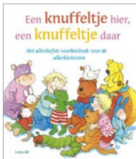
Een knuffeltje hier, een knuffeltje daar Leopold B.V. ISBN 978 90 258 6405 7

De volgende boekjes passen bij het thema 'Ik en mijn familie':