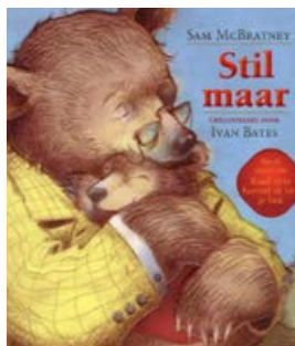
Stil maar Sam Mcbratney Veltman Uitgevers B.V. ISBN 978 90 483 08064