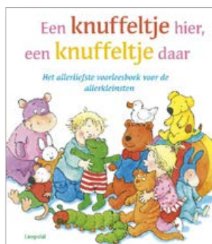
Een knuffeltje hier een knuffeltje daar Leopold 978 90 258 6405 7