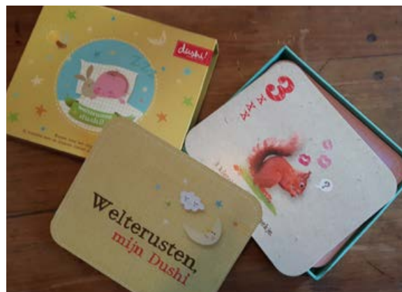
Een doos vol kusjes!