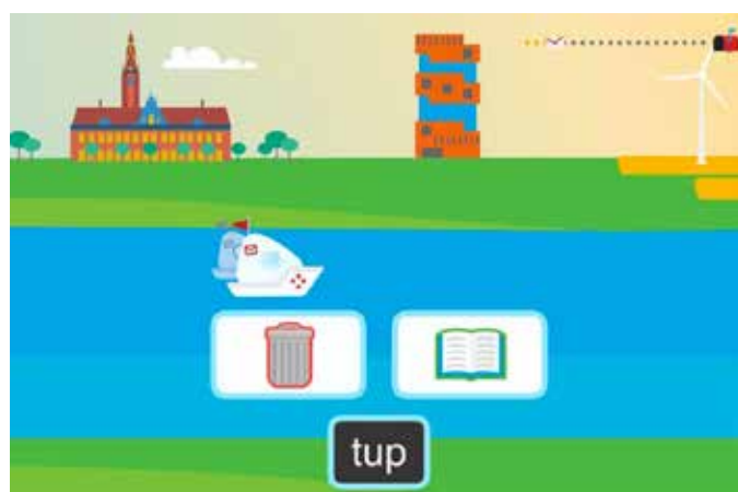
Figuur 2. Voorbeeldopgave in Leesturbo waarin kinderen bepalen of een woord bestaat of niet.

Als kinderen een woord correct gecategoriseerd hebben, gaat het witte racevoertuig van postbode Tim vooruit met de actuele leessnelheid van een kind. Het doel van de game is om sneller te racen dan het grijze voertuig, dat voortgaat met de gemiddelde leessnelheid van dit kind. Zo worden kinderen