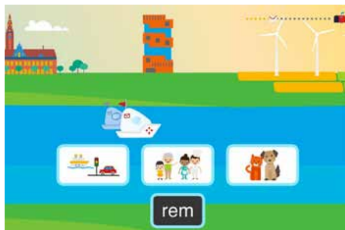
Figuur 1. Voorbeeldopgave in Leesturbo waarin kinderen bepalen in welke betekenis-gerelateerde categorie een woord hoort.

In Leesturbo kunnen kinderen postbode Tim helpen met het bezorgen van zijn post door in elke opgave een woord (bijvoorbeeld 'rem') zo goed en snel mogelijk in de juiste betekenis-gerelateerde categorie (bijvoorbeeld verkeer, mensen of dieren, zie Figuur 1) of lexicale categorie (bestaand woord of onzinwoord, zie Figuur 2) te slepen.